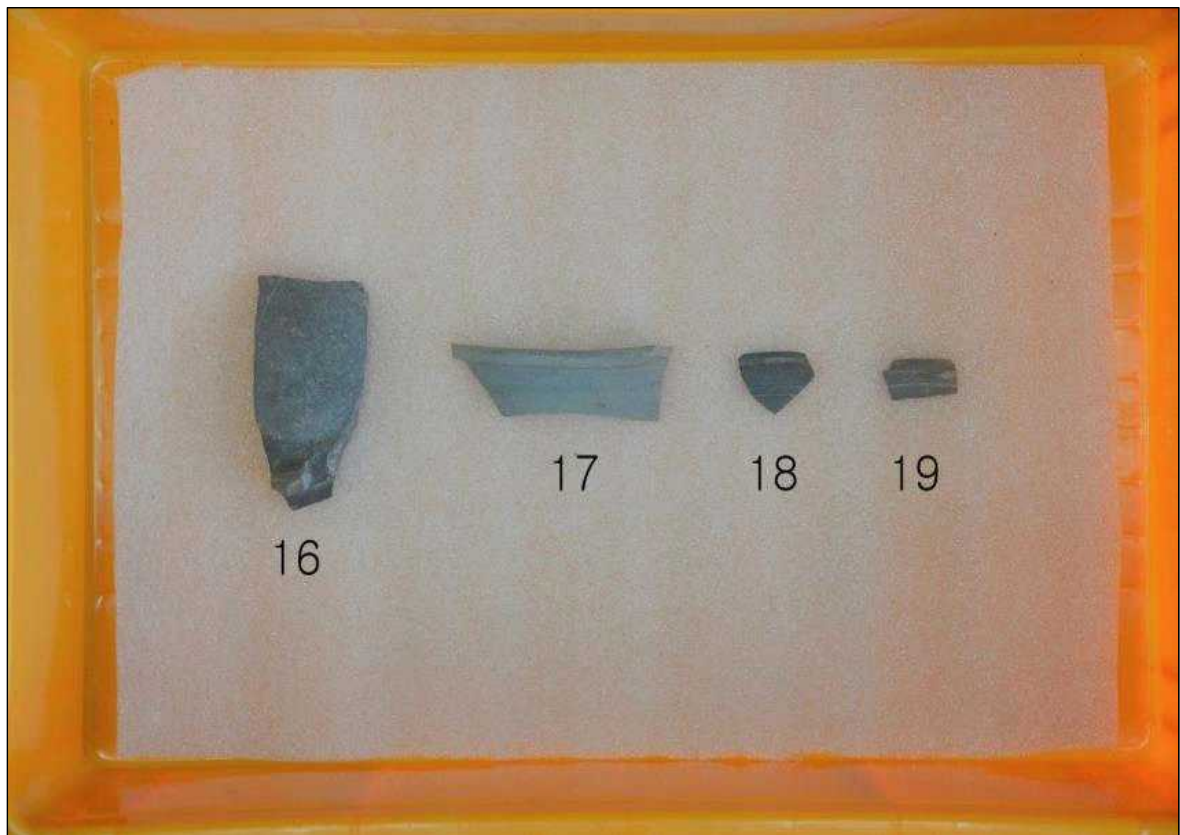
6호 수혈 출토유물