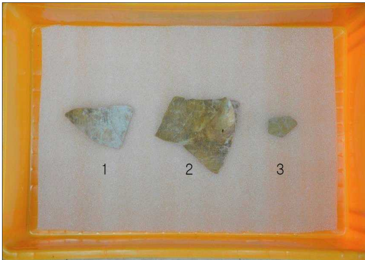
1호 수혈 출토유물