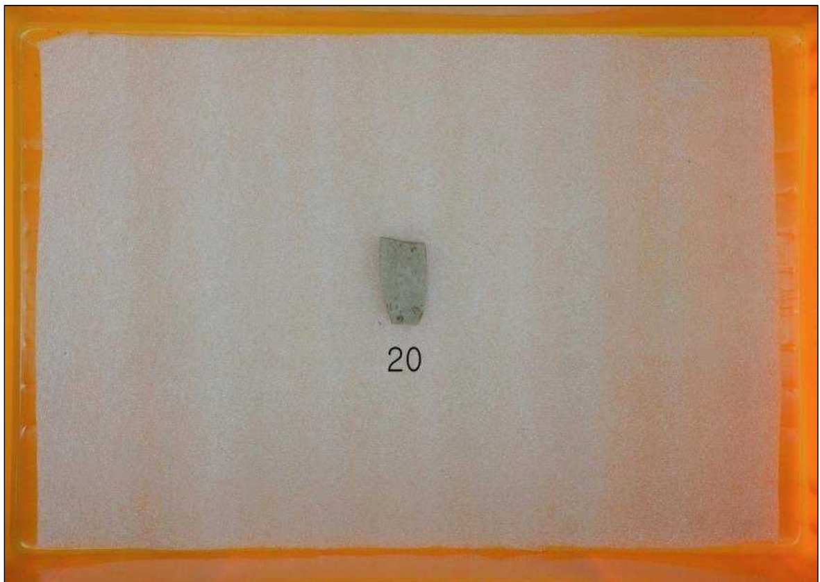
9호 수혈 출토유물