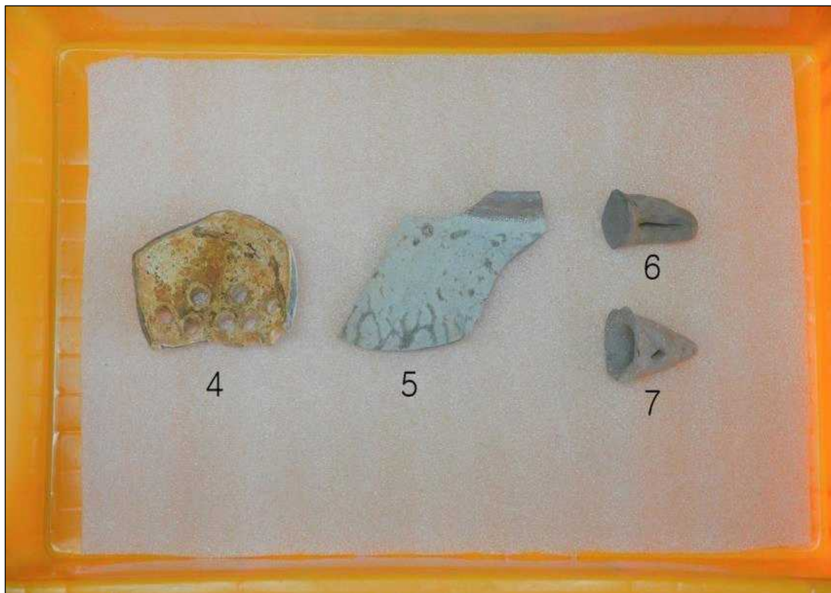
4호 수혈 출토유물