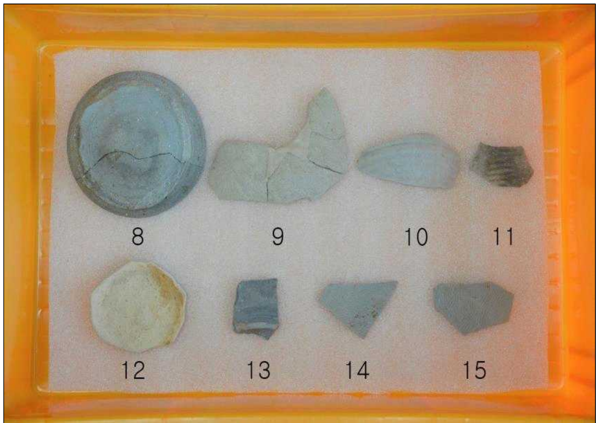
5호 수혈 출토유물