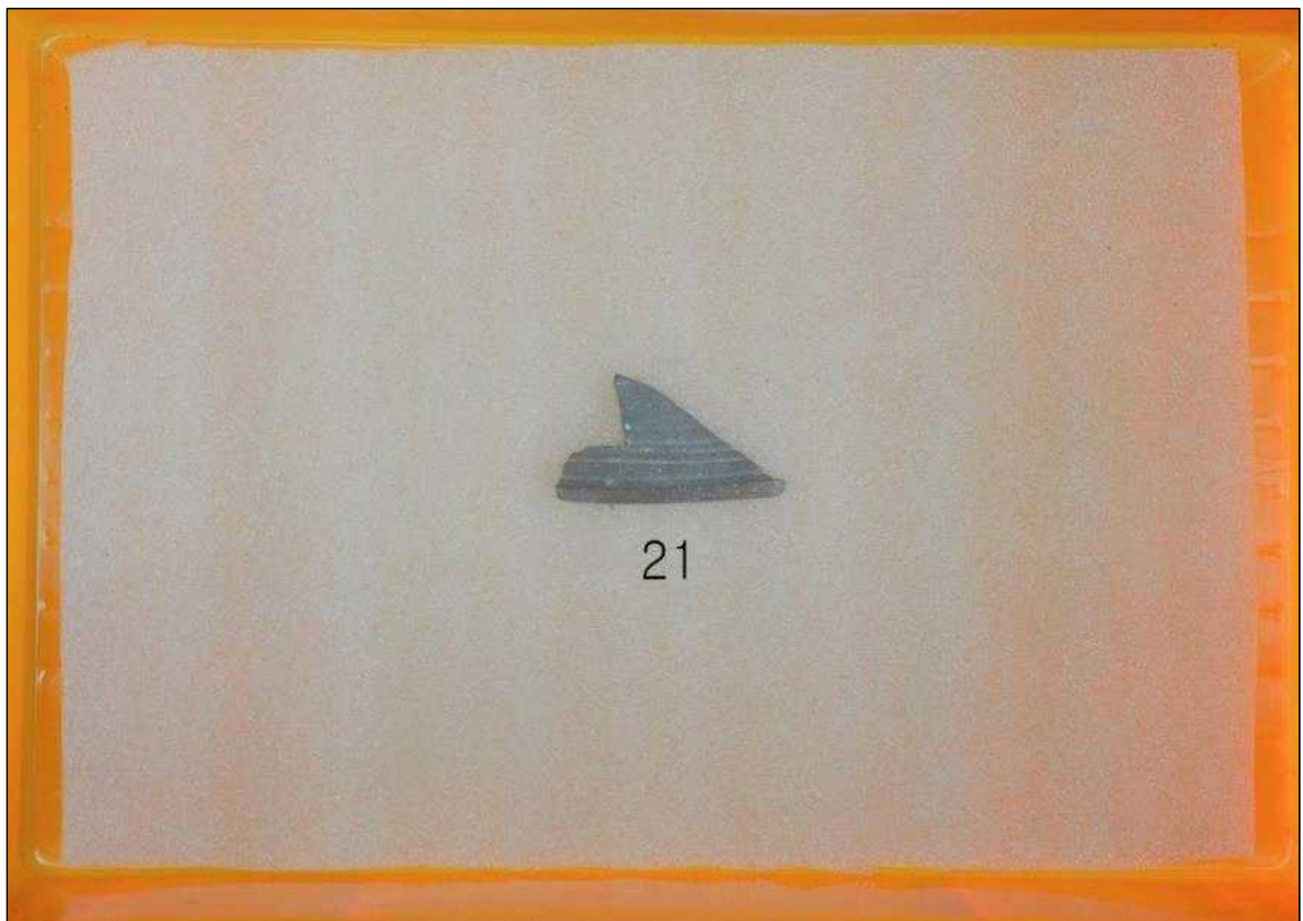
3호 소형수혈 출토유물